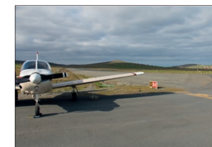
Les shetlands -Tingwall, piste courte en descente et vent de travers.