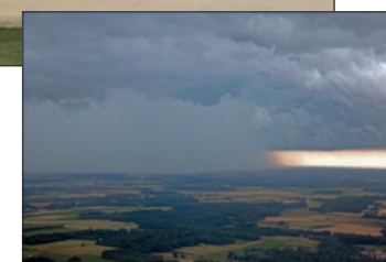
Cellule orageuse sur Oleron.

Jersey, avec sa piste de 1700 m alignée en 08-26, est très accueillante pour l'aviation générale. L'atterrissage peut se faire entre deux vols commerciaux avec un peu d'attente. L'aéro-club de Jersey est réellement à la disposition des