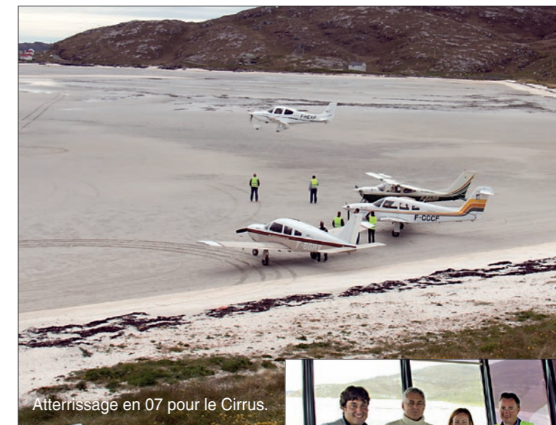
Atterrissage en 07 pour le Cirrus.