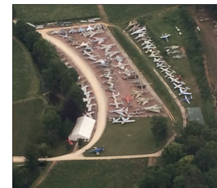
Musée du château de Savigny-lès-Beaunes.