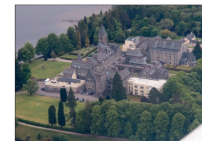
Château au bord du Loch Ness.