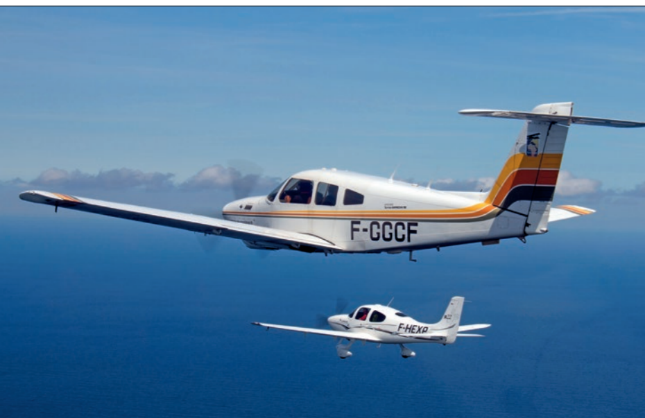
Vol en formation entre les deux Piper PA-28 et le Cirrus SR22.