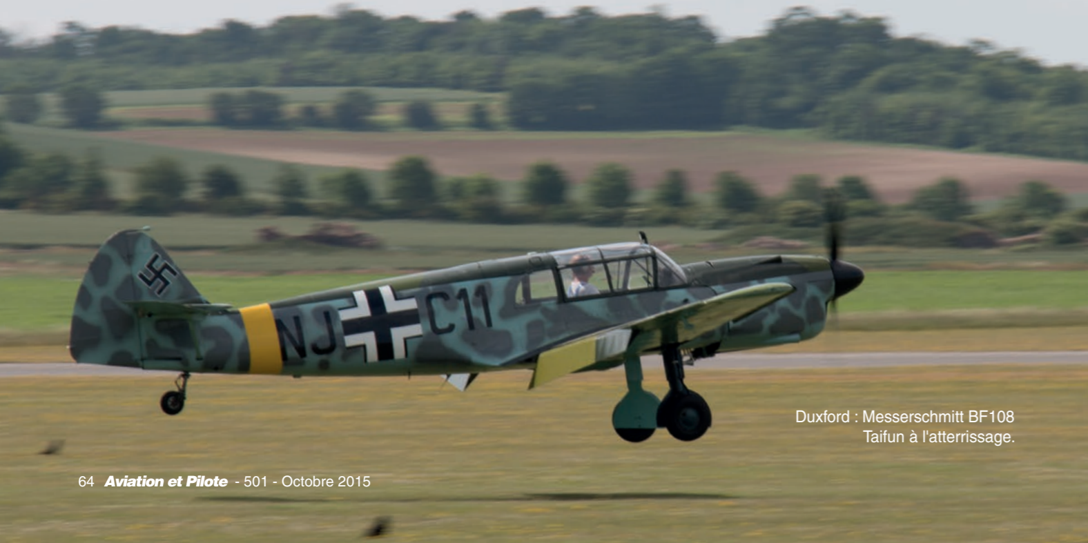
Duxford : Messerschmitt BF108 Taifun à l'atterrissage.