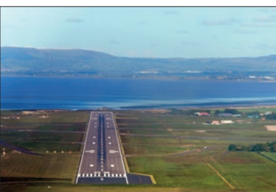
Approche sur Londonderry.

pilotes visiteurs. Le parking, le refueling, l'assistance sont vraiment exceptionnels. S'il y a un aéroport à recommander, c'est vraiment celui-là. À £1,05 le litre, soit environ 1.50 € le litre, faire le plein est un plaisir. Les taxes d'atterrissage à £13.23 sont raisonnables, avec même une réduction pour les membres AOPA. Le parking aviation générale est quant à lui gratuit.