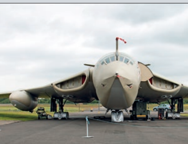
Elvington : un Handley Page Victor.