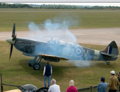
Duxford : un Spitfire biplace au démarrage.

C'est le terrain le plus proche de la ville de Lerwick. Le taxi nous y emmène pour trouver un hôtel mais il y a un congrès Total – les plates-formes pétrolières sont nombreuses dans le coin. On nous propose une sorte d'auberge de jeunesse avec une chambre à 4 lits superposés et une chambre double. Ce soir, ce sera ambiance colonie de vacances. En partant pour le restaurant, nous apercevons un couple de phoques qui joue sur la jetée. Nous faisons « local » en goûtant la fameuse panse de brebis farcie. Ce « Haggis », bien cuisiné, est très bon. Au moment de payer, en livres bien sûr, le serveur nous rattrape car il ne connaît pas ces billets venant d'Irlande du Nord aux motifs et portraits différents de ceux d'Écosse ou d'Angleterre. Au bout de 20 minutes de discussion, il finit par les accepter, il n'y a pas de raison. Finalement, l'Euro a du bon.