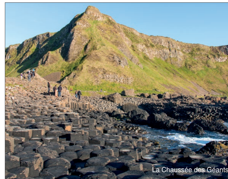
La Chaussée des Géants.